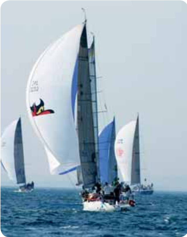
De Ierse Teng Tools importeur Eamon Crosbie met zijn zeilboot "Voodoo Child".